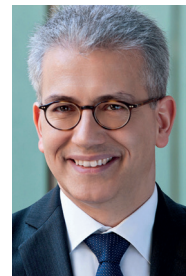
Tarek Al-Wazir Hessischer Minister für Wirtschaft, Energie, Verkehr und Landesentwicklung

„Mit einer dualen Berufsausbildung lassen sich mehrere Ziele gleichzeitig erreichen: Man erhält einen anerkannten Berufsabschluss mit besten Zukunftsaussichten, kann außerdem einen höheren Schulabschluss erwerben und verdient auch noch Geld. Die duale Berufsausbildung ist daher eine interessante Alternative. Alle Prognosen sagen hervorragende Aussichten für Arbeitskräfte mit beruflicher Bildung voraus.“